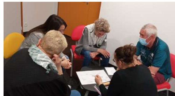
groupe de travail pendant un atelier