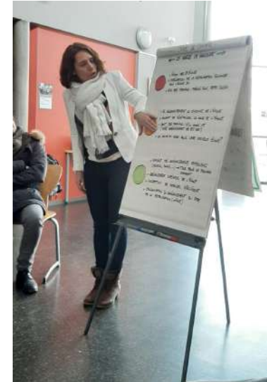
Présentation des marges de manoeuvre aux participants